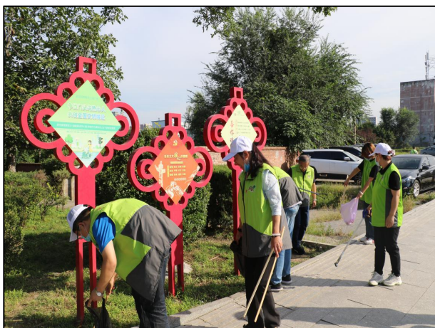
区农业农村局 开展志愿服务活动