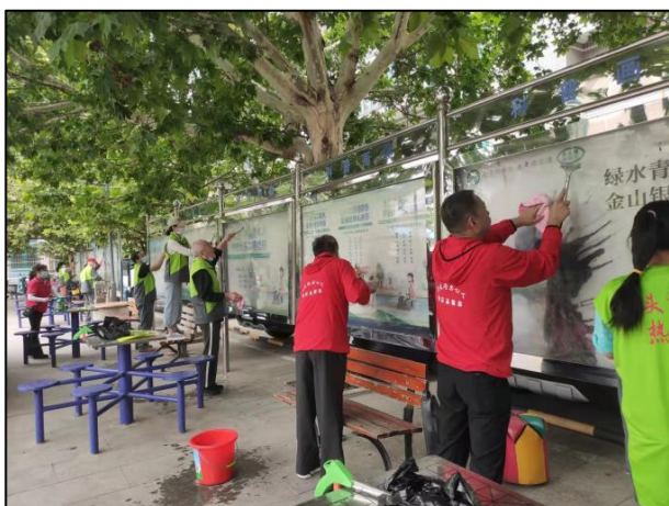
龙泉镇组织各新时代文明实践站 开展志愿服务活动