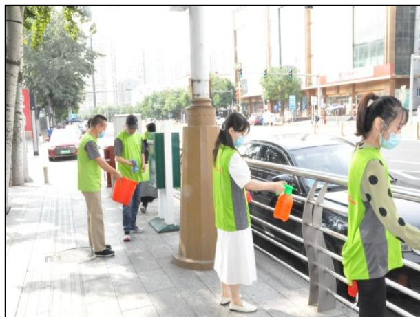
区机关事务管理服务中心 开展志愿服务活动